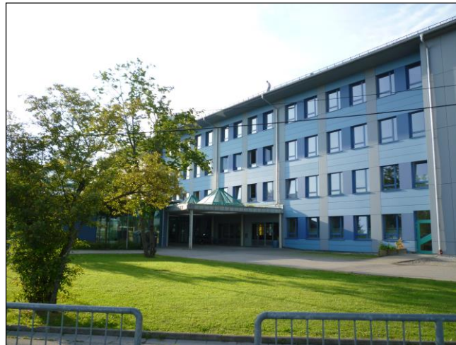
Mehr Bildung • Bessere Berufschancen • Kein Abschluss ohne Anschluss